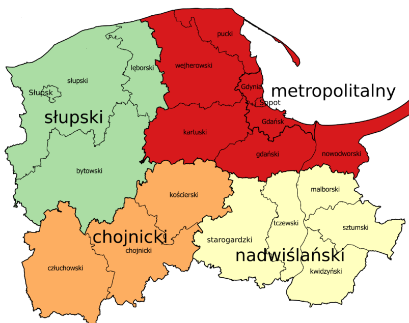
Mapa 2. Subregiony województwa pomorskiego.